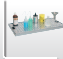
Lochblech- Inlet, Zubehör